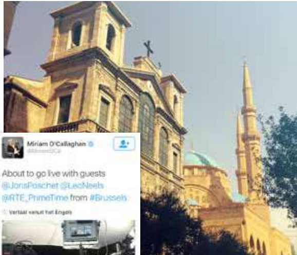
Live-interview op het 'Terzake' van Ierland na de aanslagen van 22 maart.

Het werk is daarmee niet af. We mogen nooit de schouders laten hangen. Beiroet bewijst dat samenleven mogelijk is – zelfs na een bloedige burgeroorlog.